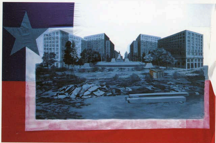
SERIE FIRST PERSON PLURAL | Voluspa Jarpa | 2000 | Detalle de obra maqueta de Altar de la Patria | 0.80m x 1.20m x 0.90m | Galería Canvas International Art | Amsterdam, Holanda