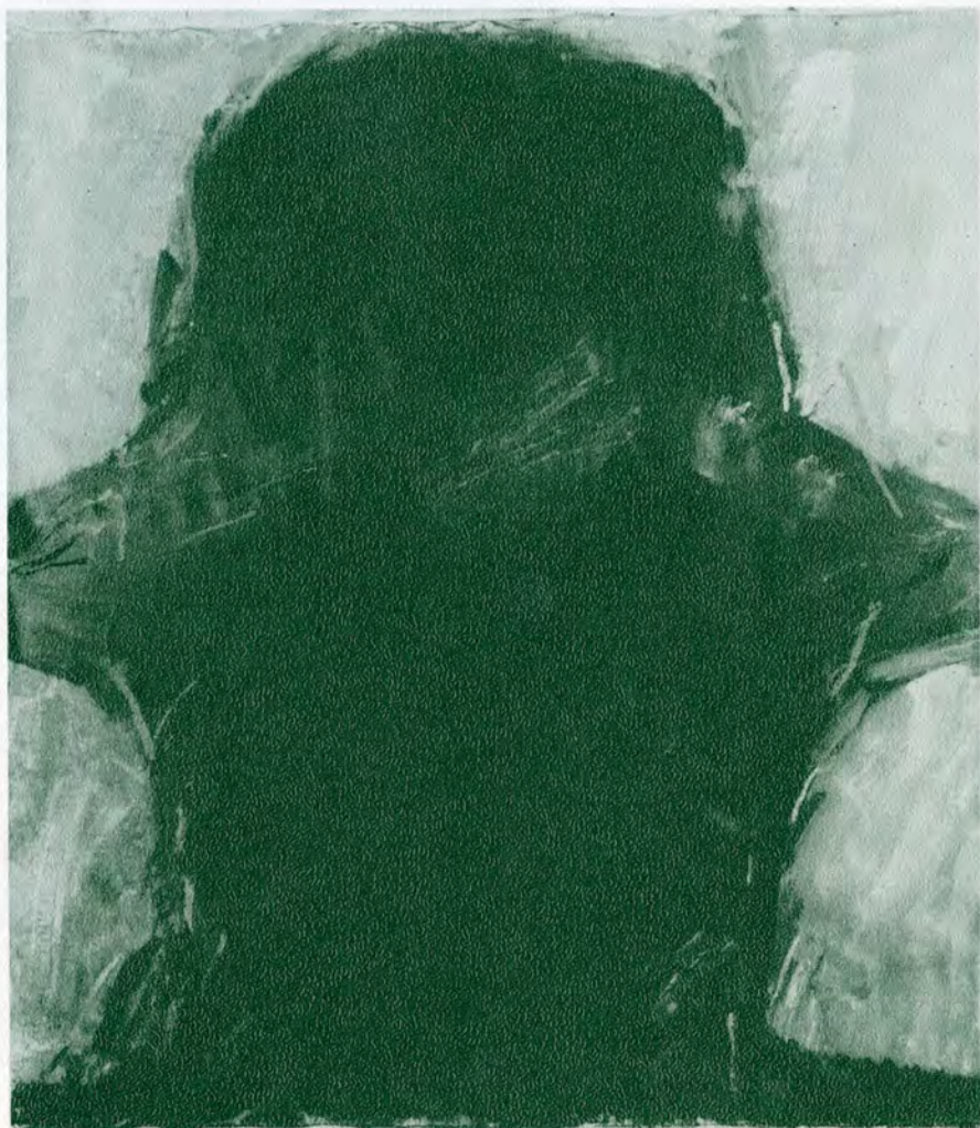
Cabeza de hombre 1989

Pintura acrílica y pastel sobre tela 1.50 x 1.35 cms.